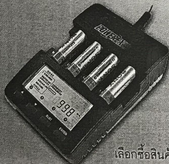
เลือกซื้อสินค้าที่สามารถใช้ซ้ำได้