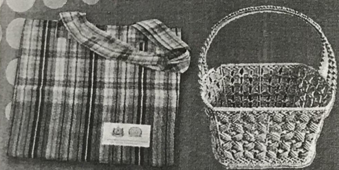
ใช้ถุงผ้า ตะกร้า แทนการใช้ถุงพลาสติก

ใช้น้อย หรือ ลดการใช้ หมายถึง การลดปริมาณการใช้ลง โดยใช้เท่าที่จำเป็น หลีกเลี่ยงการใช้ของฟุ่มเฟือยเพื่อลดการสูญเปล่า และลดปริมาณขยะให้มากที่สุด