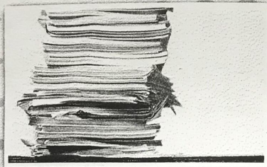
ใช้กระดาษทั้งสองหน้า

ใช้ซ้ำ หมายถึง การนำของเสียบรรจุภัณฑ์หรือวัสดุเหลือใช้กลับมาใช้อีกโดยไม่ผ่านขบวนการแปรรูปหรือแปรสภาพ