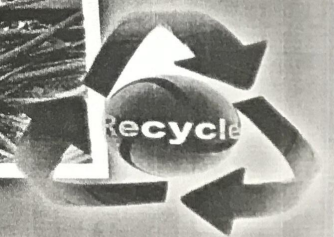
สัญลักษณ์รีไซเคิล