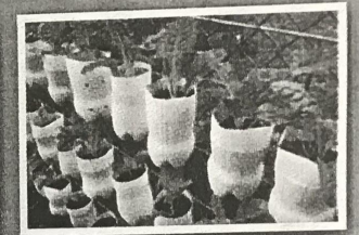
ใช้ซ้ำหลายครั้งก่อนทิ้ง