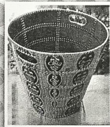
การทำสิ่งประดิษฐ์จากวัสดุเหลือใช้