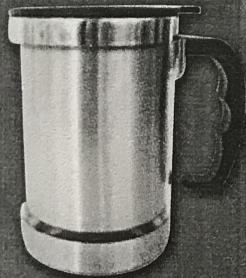
ใช้แก้วส่วนตัวแทนการใช้แก้วพลาสติกหรือแก้วที่ใช้ครั้งเดียวแล้วทิ้ง