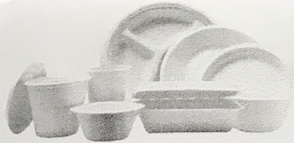
เลือกบรรจุภัณฑ์ที่เป็นมิตรกับสิ่งแวดล้อม