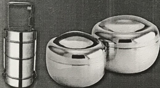
ใช้ปิ่นโต หรือกล่องใส่อาหารแทนการใช้ กล่องโฟม