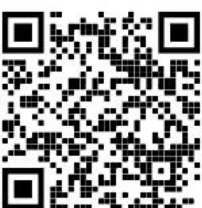
ค่าธรรมเนียม